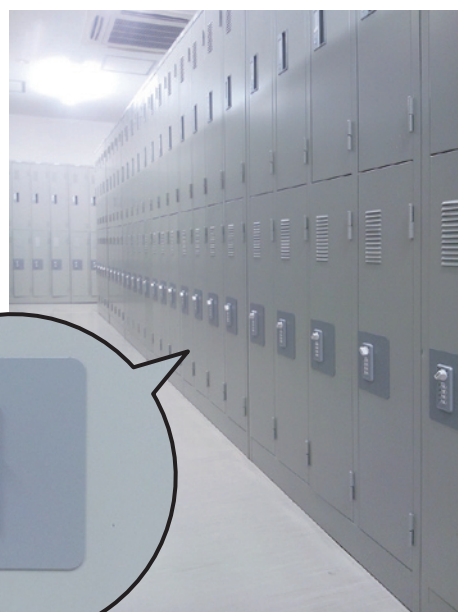
ダイヤル錠タイプ