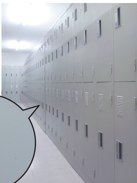
シリンダー錠タイプ