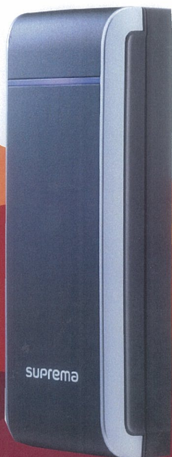
Smart IP Access Reader

さらに、RS485及びWiegandをサポートしているため、既存の入退システムへのスペックインも可能にしました。BioStarソフトウェアにより、セキュアでスマートなアクセスコントロールを提供します。