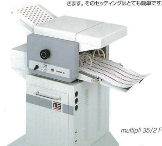
multipli 35/2 F

フリクションフィーダーF35は、摩擦によって(コシ給紙)、サシミ状にさばいた用紙を一番上から1枚1枚正確にフィードしていきます。そのセッティングはとても簡単です。