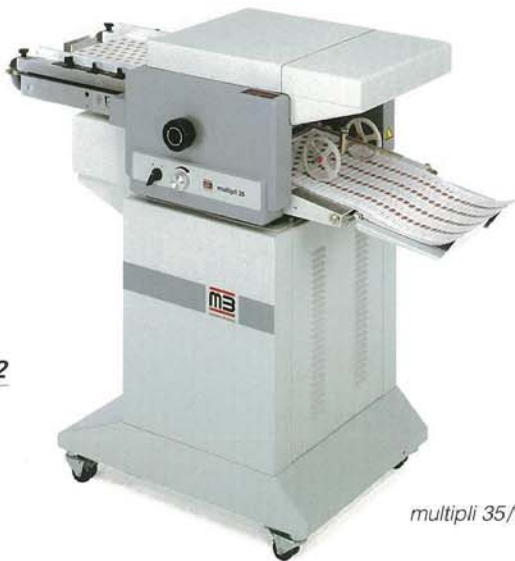
multipli 35/2 S