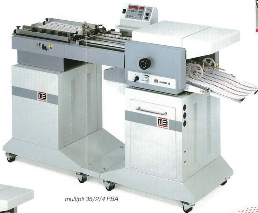
multipli 35/2/4 PBA

サクシンドラムで、積載物の一番下からフィードしていきますので、連続して上積み給紙が可能です。