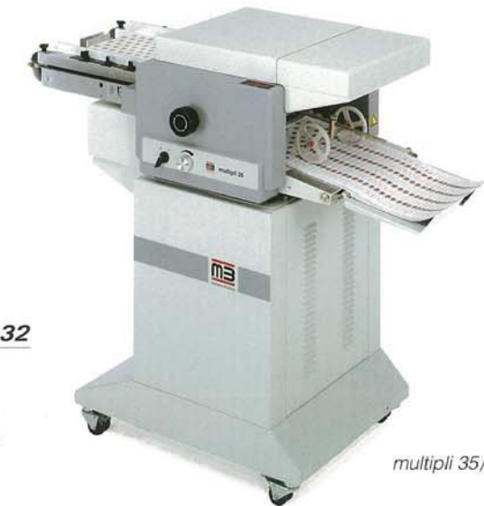
multipli 35/2 S