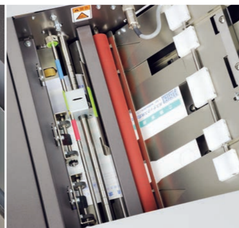
スリッター（オプションで、電動スリッターにすることも可能）