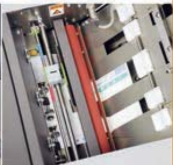
スリッター（オプションで、電動スリッターにすることも可能）