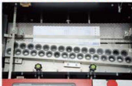
アライニング装置による軌道修正機能により、 処理のロス率を低減。