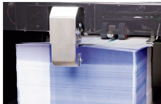
給紙部の送風装置（ブローア）により、給紙の安定性がアップ。