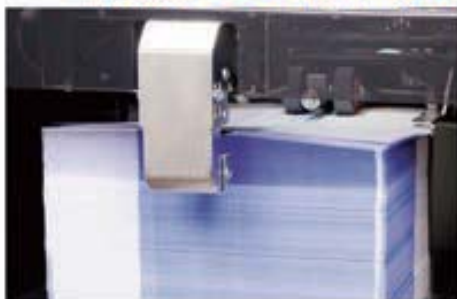
給紙部の送風装置（ブローア）により、給紙の安定性がアップ。 ※ブローアは、大容量タイプのみの仕様となります。