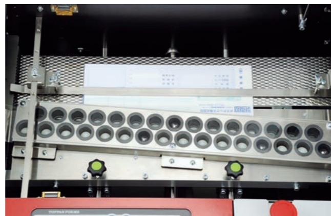
アライニング装置による軌道修正機能により、処理のロス率を低減。