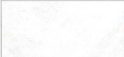
真っ白で模様はほとんど見えません。